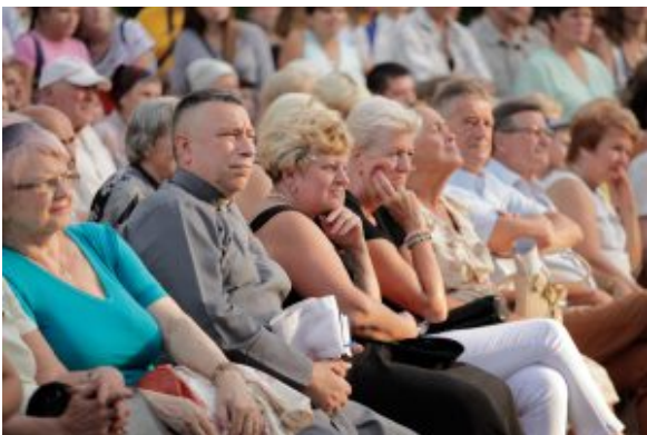
Глядачі театральної вистави «Заклята Пані»