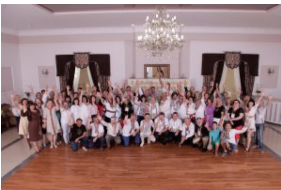
Учасники форуму кредитних спілок

31 із 37 опитаних відповіли на запитання «Які ідеї, думки, відчуття, дух тощо ви особисто винесли із Форуму?»