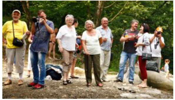
Форумчани біля гірської річки Сукіль