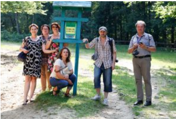
Форумчани на вході до пам'ятки природи «Скелі Довбуша»