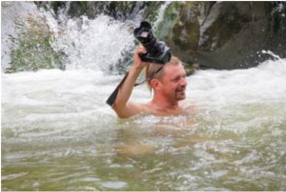
Олексій Палій.