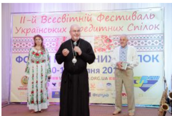
Владика Тарас Сенків

Святкова вечірка: «Кредитна спілка «Вигода» – 25 років служіння громаді» стала завершальним акордом змістовного дня для всіх, хто фізично та подумки відвідав Форум кредитних спілок на Стрийщині , підтримавши в такий спосіб Всесвітній фестиваль українських кредитних спілок , що триває.