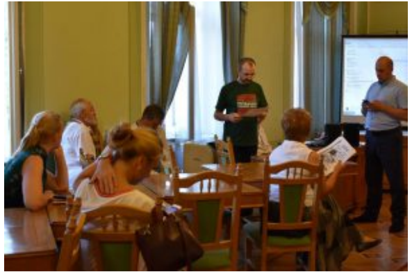
За мить до прес-конференції.

Всесвітній фестиваль обіцяє нагадати українцям про цінність і вигоду кооперації. Також свято звучатиме українськими піснями, прийматиме іноземних гостей і розповість про кредитні перспективи, – повідомило Львівське радіо.