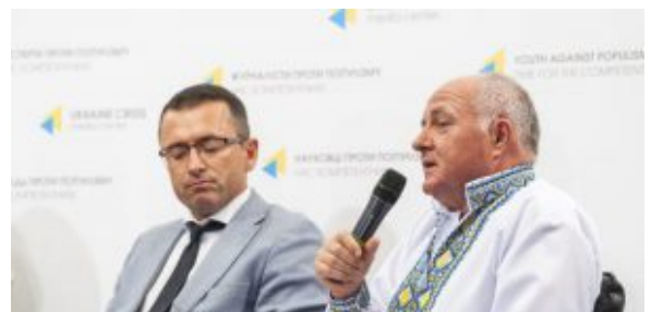
Петро Козинець, Президент Національної асоціації кредитних спілок України

Ольга Мороз , Президент Всеукраїнської асоціації кредитних спілок, зазначила, що головною темою форуму буде зміцнення руху кредитних спілок. «Форум має виробити дороговкази для кредитівок і держави щодо: самоорганізації ринку і його фінансової підтримки; співпраці з громадськими і релігійними організаціями, профспілками, місцевою владою, впровадження у сервіси інформаційних інновацій», – додала вона.