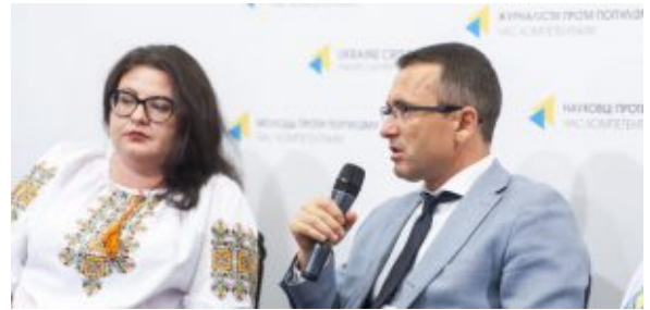
Віктор Романюк, народний депутат України, голова підкомітету небанківських фінансових установ

кредитних спілок в Україні зменшилась з 700 до близько 400.